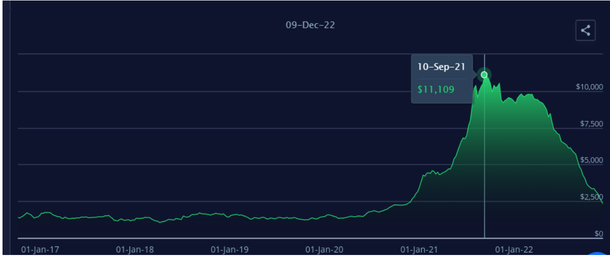
Qrafik 1. FBX Qlobal Konteyner İndeksi (2017-2022)

Bu dövrdə malların əksəriyyətinin beynəlxalq daşınma vasitəsi konteynerlərlə olduğu üçün böyük gəmilərin daşınma xərclərində kəskin artım müşahidə olundu. Daşınma xərclərinin nə qədər artması FBX Qlobal Konteyner Daşınma İndeksini vasitəsi ilə müəyyən olunur. 2020-ci ilin fevral ayı ilə müqayisədə bu indeks 8 dəfə artaraq hər konteyner üçün təxminən 1300 dollardan 2021-ci ilin sentyabrında 11000 dollara qədərbahalaşmış. Daşınma marşrutlarının fərqliliyi ilə xərclər də dəyişir. Məsələn, Çindən bir konteynerin ABŞ-ın Qərb Sahillərinə göndərilməsi xərcləri 2020-2022-ci illərdə 12 dəfədən çox artaraq 1300 dollardan 16000 dollara yüksəlib. 8